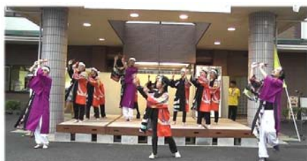
あゆみが丘学園の園生さんに、「よさこい踊り」を披露して頂きました。力強い踊りで圧倒されました。