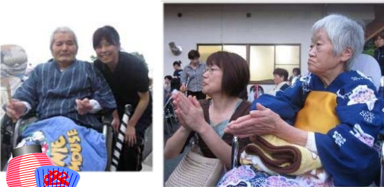
ご家族の方と一緒に...