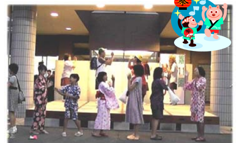
みんなでマルモリダンス大変盛り上がりました