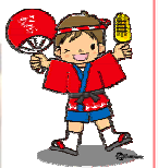
たくさんのボランティアの方に協力して頂き、大盛況でした。