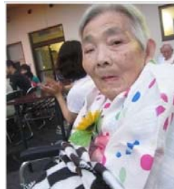
夏を感じさせる、素敵な浴衣姿です