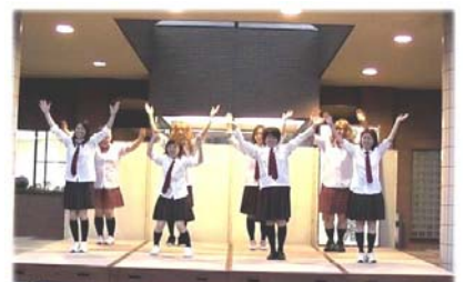
おおみや苑のAKB48会いたかった～