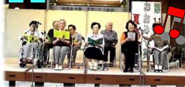
ケアハウスのご入居者の方による合唱です。