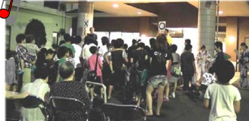
全員参加型のクイズ大会！幅広い問題が出ました。楽しんでいただけただけでしょうか。